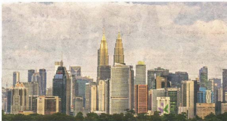
PENGUKUHAN kesejahteraan sosial dalam Malaysia Madani perlu mengutamakan bandar kebolehhidupan kepada warganya.

Ketiga perlu bebas daripada perbuatan salah laku yang tidak bermoral dan melanggar perundangan. Keempat, mengenai kos sara hidup yang mampu menyebabkan ketidakstabilan keharmonian kehidupan keluarga dan masyarakat. Dan akhir sekali adalah melihat kepada