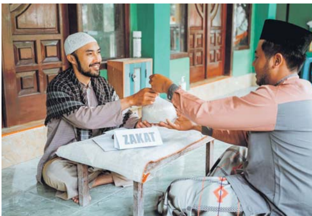
ISLAM sebagai agama yang selari dengan fitrah manusia memandang peranan harta sebagai sesuatu keperluan asas mereka, di samping amalan ketaatan dan ibadah yang berkait rapat dengannya.