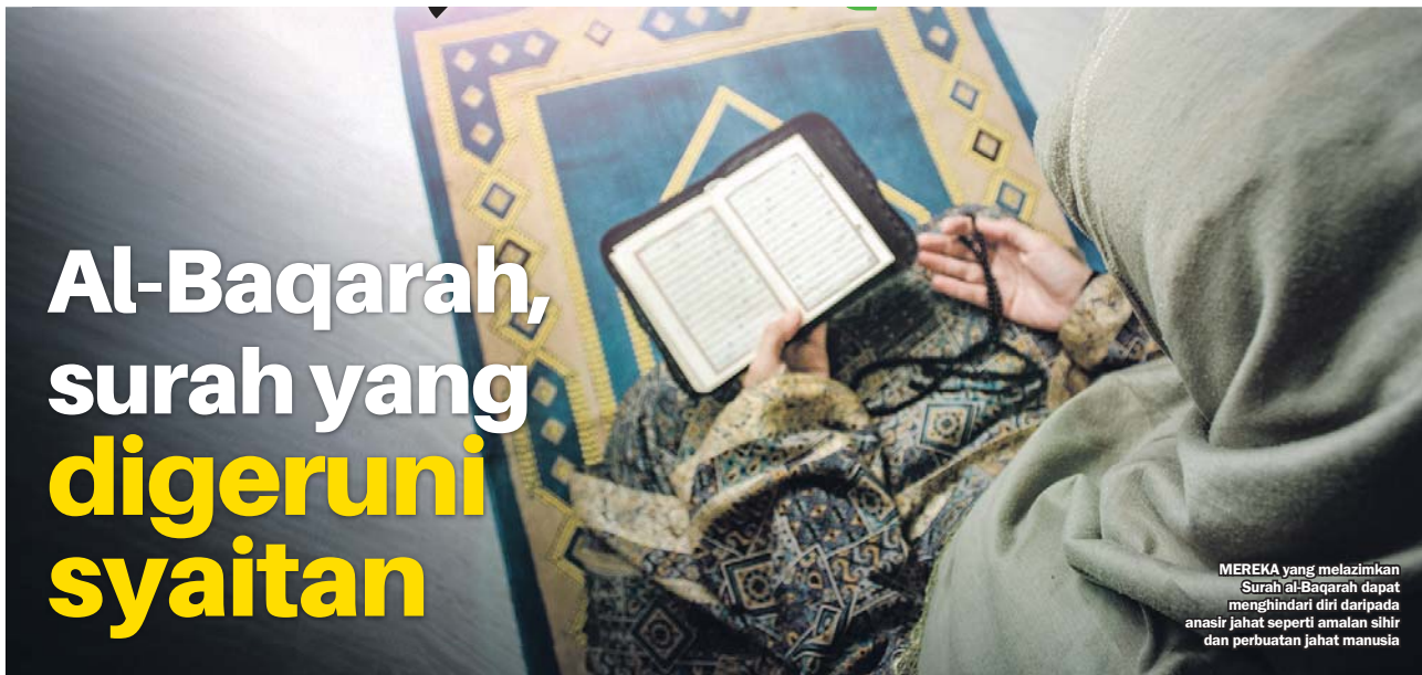
MEREKA yang melazimkan Surah al-Baqarah dapat menghindari diri daripada anasir jahat seperti amalan sihir dan perbuatan jahat manusia

Selain membawa keberkatan dalam kehidupan Muslim, ia memuatkan beberapa hukum yang tidak disebutkan dalam mana-mana surah lain