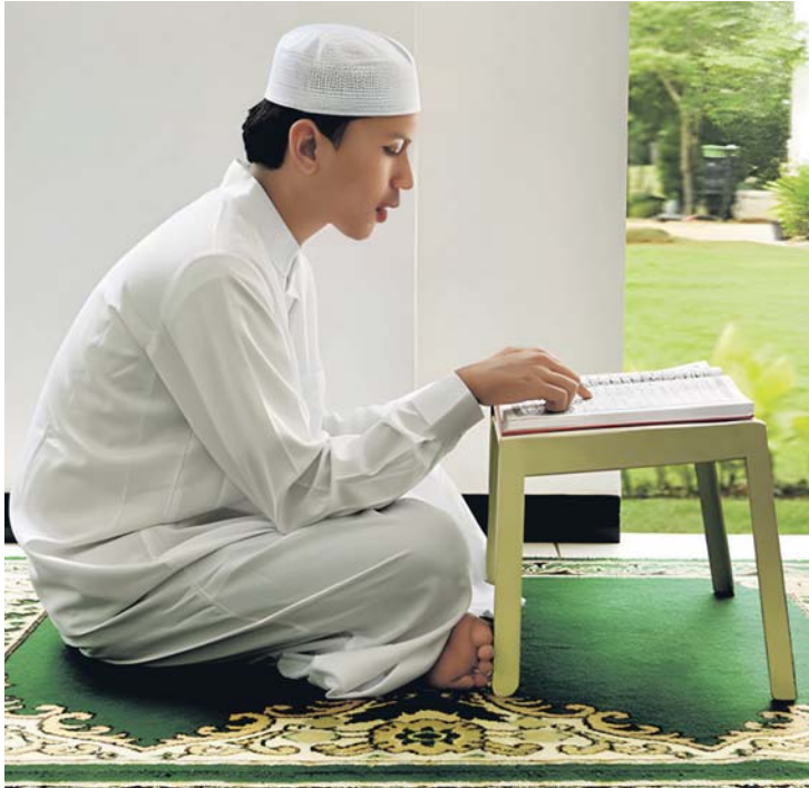
BENTENGI diri dan kediaman kita dengan membaca Surah al-Baqarah.

BUKAN hanya 'orang biasa', Surah al-Baqarah turut menjadi pilihan para perawat Islam (mu'alim) dalam proses rawatan terutama bagi memulihkan mangsa gangguan makhluk halus.