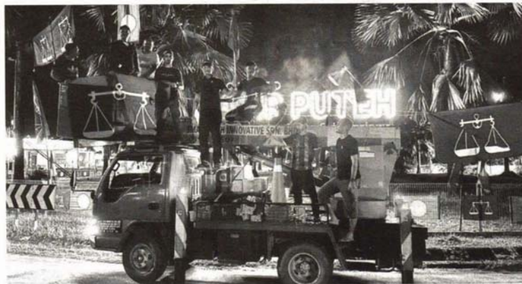
BN-PH perlu melaksanakan jelajah siri turun padang di seluruh Kelantan bagi menguatkan silaturahim dengan akar umbi.

Kekurangan tokoh berwibawa dalam kalangan pemimpin BN-PH sedikit sebanyak mempengaruhi sokongan anak muda."