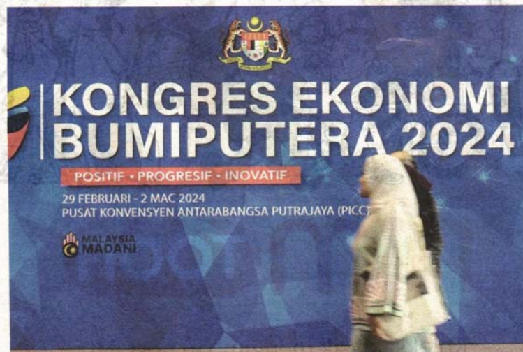
KERAJAAN perlu wujudkan lebih banyak platform bagi membantu meningkatkan ekonomi bumiputera walaupun selepas tamatnya Kongres Ekonomi Bumiputera (KEB) pada 2 Mac lalu.

Keupayaan untuk membangunkan ekonomi golongan ini terbuka luas, cuma kaedah yang digunakan kerajaan hari ini kurang sesuai mengikut perubahan masa."